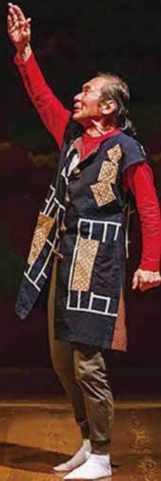
題字：栗原光華

原作 石牟礼 道子 出演・構成・演出 井上 弘久 音楽 吉田 水子 作曲（不知火海のテーマ）金子 忍